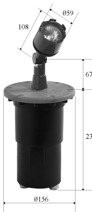
Cotes en mm