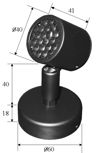
Cotes en mm