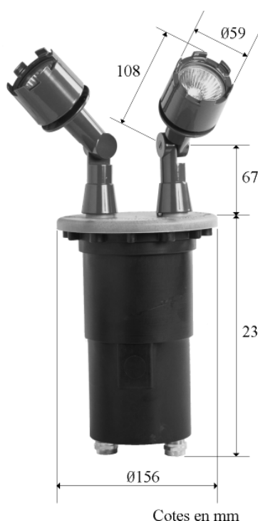
Cotes en mm